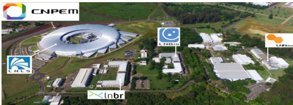
Figura 2 Mudanças e movimentação entre os prédios do CNPEM